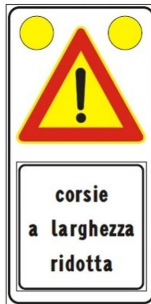
Figura II 391c Art. 31