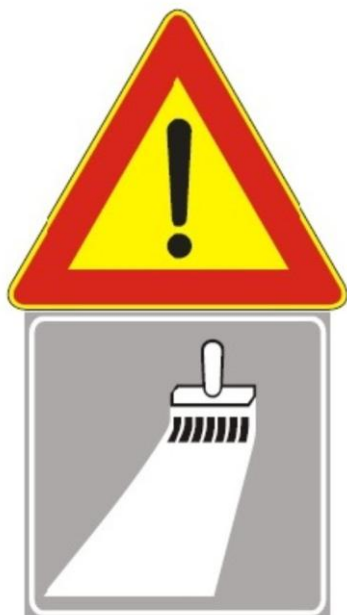
Figura II 391 Art. 31

Segnaletica consigliata nel caso di intervento su strade aperte al traffico veicolare